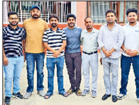
सिरसा। अरोड़वंश समाज की कार्यकारिणी में चुने गए पदाधिकारी।