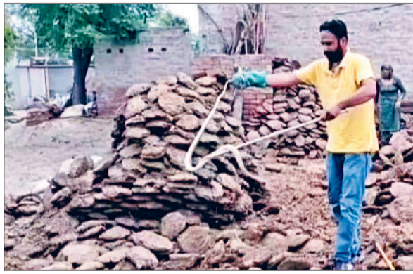
टोहाना। धोलू ढाणी में सांपों को पकड़ते रेस्क्यू टीम सदस्य।

उपमंडल के गांव धोलू की एक ढाणी में एक घर से रेस्क्यू टीम ने 5 सांपों को काबू किया है, जिसके बाद परिवार के लोगों व ग्रामीणों ने राहत की सांस की है। सहारा रेस्क्यू टीम ने सभी पांचों सांपों को सुरक्षित जंगल में छोड़ दिया है। मिली जानकारी के अनुसार गांव के उक्त घर में बीते कई दिनों से सांपों की गतिविधियां देखी जा रही थी। ग्रामीणों के अनुसार सांप अक्सर घर के आसपास दिखाई देते थे लेकिन तुरंत ही गायब हो जाते थे, जिससे लोगों को यह पता लगाना मुश्किल हो रहा था कि वे कहाँ छिप