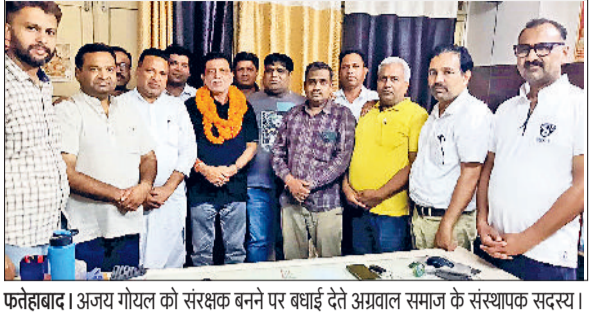
फतेहाबाद। अग्रवाल समाज के संस्थापक सदस्यों की बैठक का प्रस्ताव अग्रवाल समाज के संस्थापक सदस्यों ने

अग्रवाल समाज फतेहाबाद के 21 संस्थापक सदस्यों की बैठक कार्यालय में सम्पन्न हुई। यह बैठक समाज की 15 जून को अग्रवाल धर्मशाला में आयोजित आमसभा में लिए गए उस ऐतिहासिक निर्णय के अनुपालन में आयोजित की गई, जिसके अंतर्गत अग्रवाल समाज की आगामी कार्यकारिणी के गठन का दायित्व 21 संस्थापक सदस्यों को सौंपा गया था। बैठक की शुरुआत 21 सदस्यों द्वारा अग्रवाल समाज फतेहाबाद के प्रति आभार एवं विश्वास जताने के साथ हुई। सभी सदस्यों ने इस दायित्व को समाज के प्रति सेवा का एक सुनहरा अवसर बताया और समाज द्वारा जताए गए विश्वास हेतु