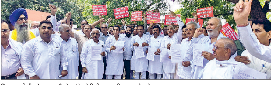
सिरसा। डीसी को ज्ञापन सौंपने पहुंचे ओबीसी व एससी समाज के लोग।

हिसार स्थित एचएयू विश्वविद्यालय के कुलपति के खिलाफ जातिगत रणनीति का आरोप लगाते हुए ओबीसी व एससी समाज की ओर से राज्यपाल के नाम सौंपा उपायुक्त के माध्यम से